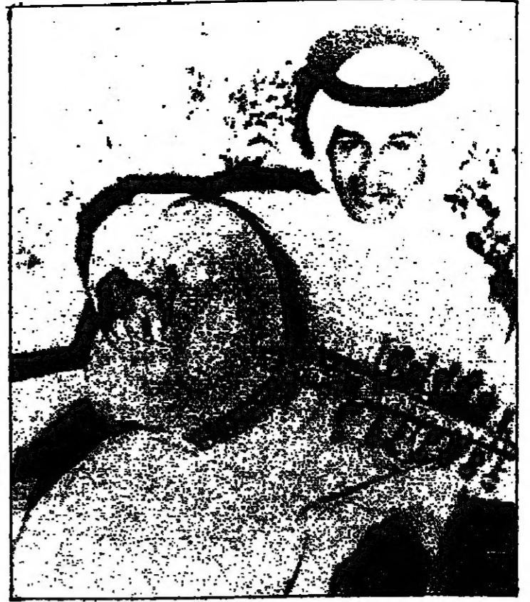
مع الفنان السعودي محمد عبده